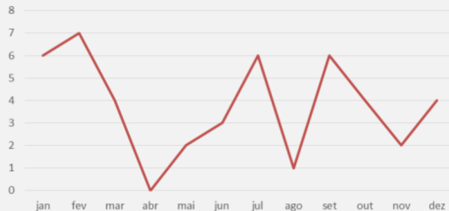
Atendimentos a Comissões e Agentes Públicos