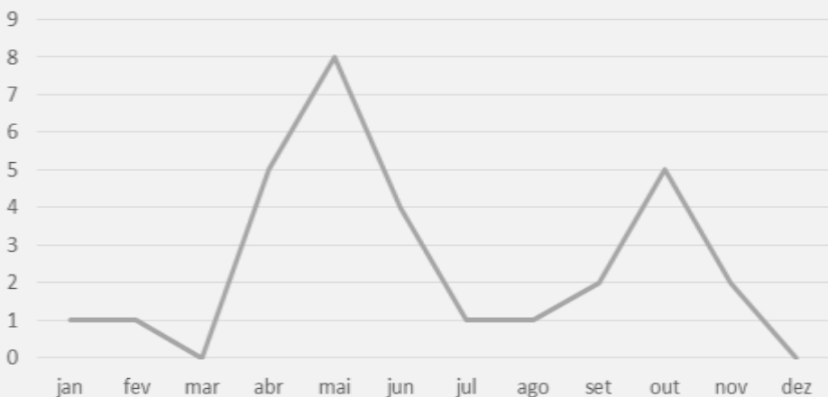
Participação em capacitações (externas)